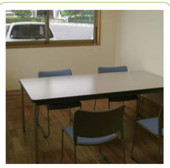
相 談 室