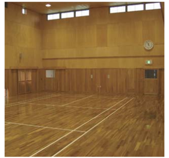
コミュニティホール