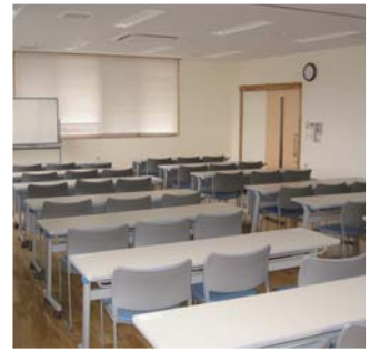
会 議 室